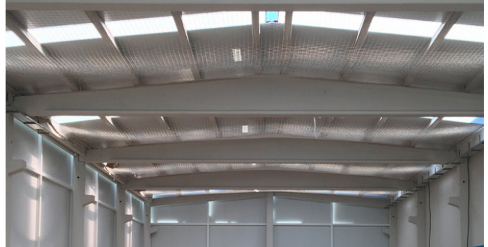
NAVE PARA CARGA DE BATERIAS BSH / SHIP TO CHARGE BATTERIES BSH